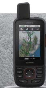
GPSMAP®67i ¥99,800 (税込)